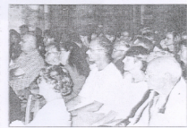
Un public touché droit au cœur. Le public fut spontanément conquis.